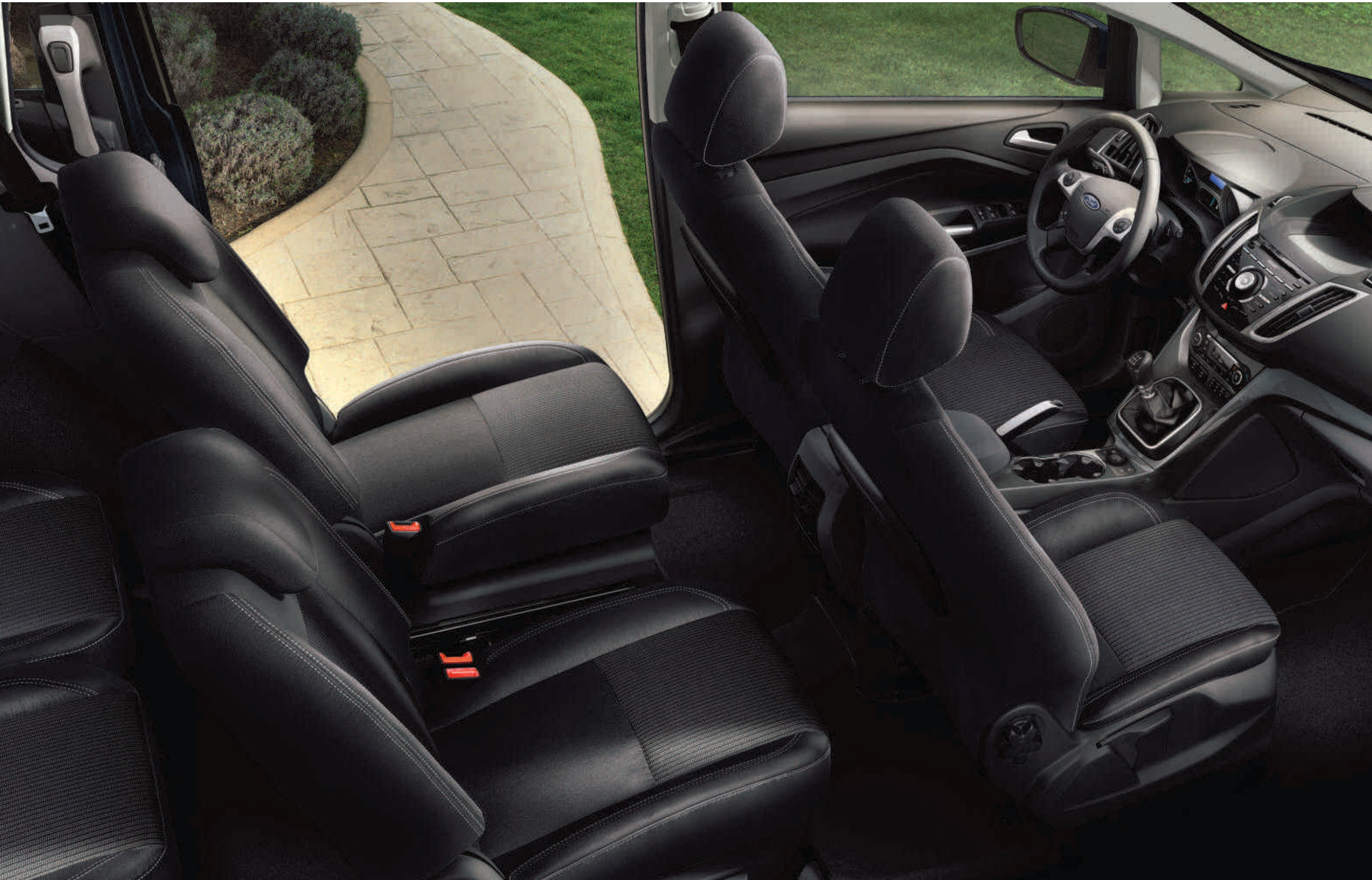
Abbildung zeigt Innenraum des Ford Grand C-MAX mit Leder-Stoff-Polsterung und weiterer Wunschausstattung

Der geräumige und vielseitige Innenraum des Ford Grand C-MAX bietet eine Vielzahl innovativer Ausstattungsdetails. Der mittlere Sitz der zweiten Sitzreihe kann schnell und einfach unter dem rechten äußeren Sitz verstaut werden und ermöglicht Ihren Passagieren der dritten Sitzreihe (Wunschausstattung) einen einfachen Einstieg. Die elektrische Tür-Kindersicherung und ein Warnsystem für nicht angelegte Sicherheitsgurte für alle Rücksitze leisten darüber hinaus einen aktiven Beitrag zur Sicherheit Ihrer Familie.