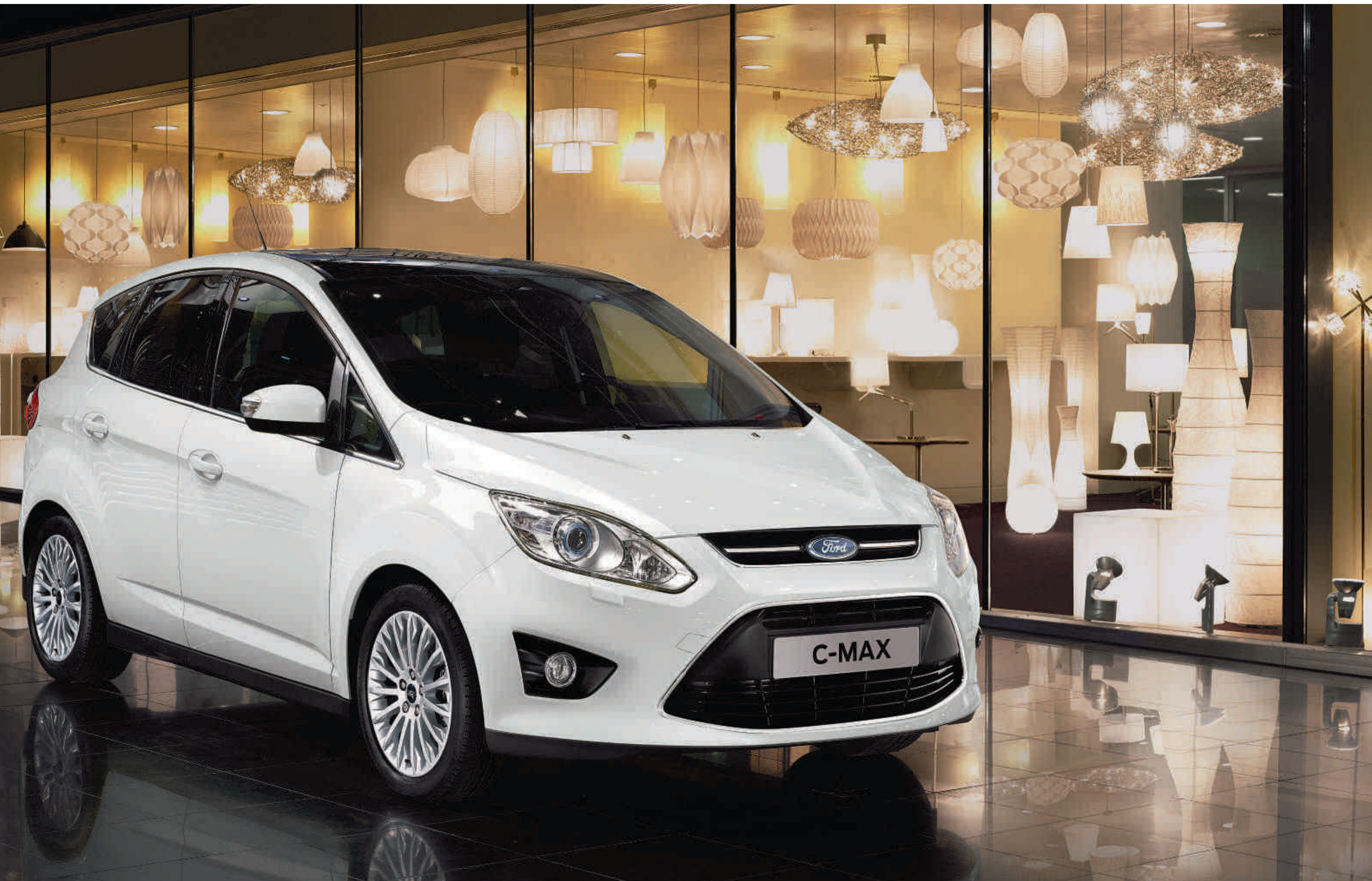
Abbildung zeigt Ford C-MAX Titanium in Frost-Weiß mit 17"-Leichtmetallrädern, Bi-Xenon-Scheinwerfern und Panoramadach (Wunschausstattung)

Der Ford C-MAX ist nicht nur ein leistungsstarkes Multifunktionsfahrzeug, sondern verkörpert gleichzeitig die neuesten Entwicklungen des Ford kinetic Designs. Kurzum vereinen sich Form und Inhalt in einer idealen Mischung aus Leistung und Leidenschaft.