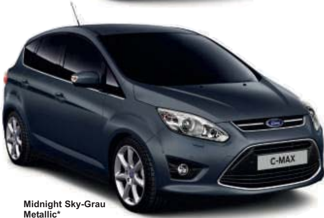
Midnight Sky-Grau Metallic*