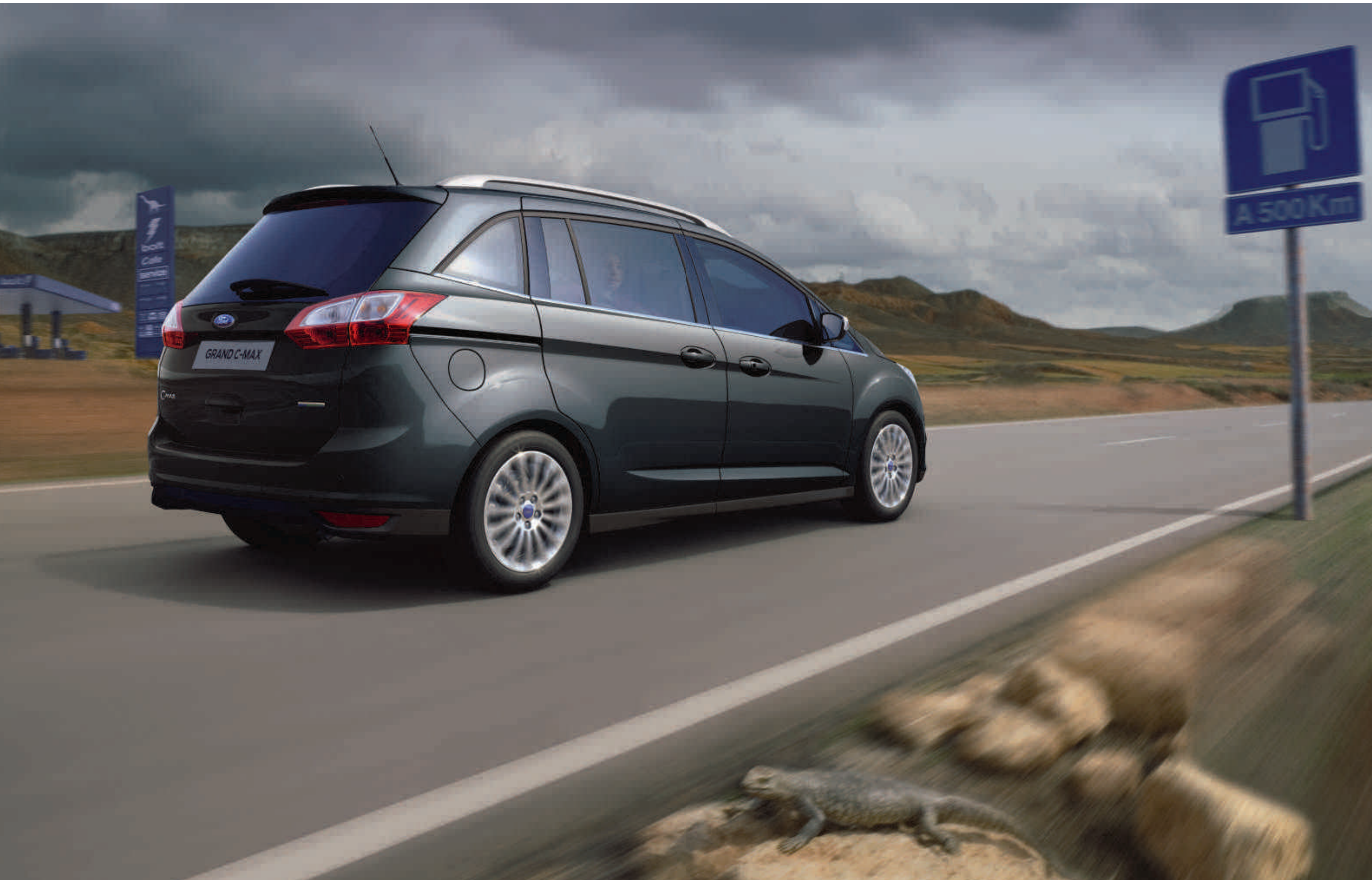
Abbildung zeigt Ford Grand C-MAX Titanium in Midnight Sky-Grau Metallic mit 17"-Leichtmetallrädern, Dachreling „Aluminium-Look“, Ford Key Free-System und getönten Seitenscheiben (Wunschausstattung)

Durch den Einsatz der modernen Ford EConetic Technology, wie dem Ford PowerShift-Automatikgetriebe, den sparsamen Ford EcoBoost-Benzinmotoren, dem effizienten Start-Stopp-System oder den fortschrittlichen TDCi-Dieselmotoren, leistet der Ford C-MAX einen deutlichen Beitrag zur Optimierung der Kraftstoffverbräuche und Reduzierung der CO 2 -Emissionen.