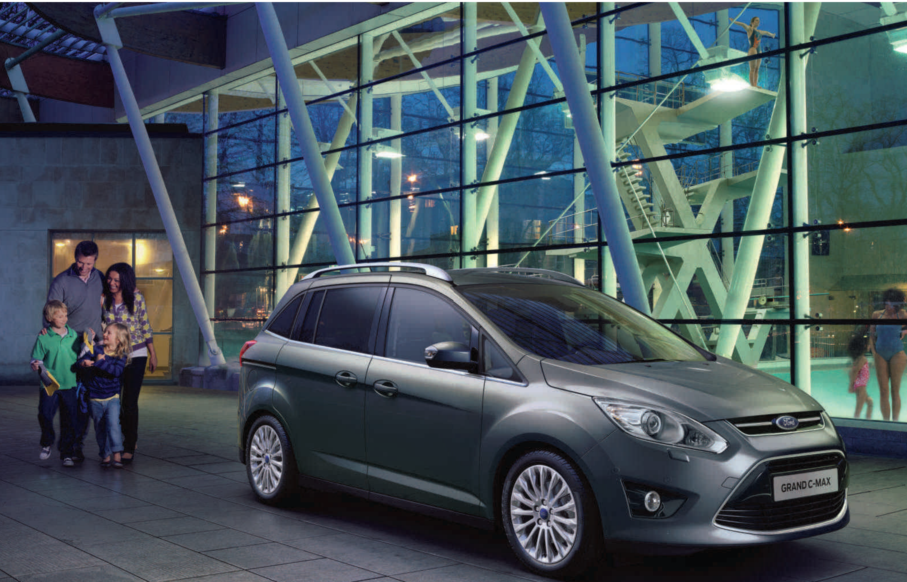
Abbildung zeigt Ford Grand C-MAX Titanium in Midnight Sky-Grau Metallic mit 17"-Leichtmetallrädern, getönten Seitenscheiben, Dachreling „Aluminium-Look“ und Bi-Xenon-Scheinwerfern (Wunschausstattung)

Der Ford Grand C-MAX kombiniert ein hohes Maß an Praktikabilität und Alltagstauglichkeit mit einem flexiblen Platzangebot. Mit seinen zwei seitlichen Schiebetüren und fünf oder optional sieben Sitzen ist er bestens ausgestattet, sodass Sie ihr Familienleben in vollen Zügen genießen können.